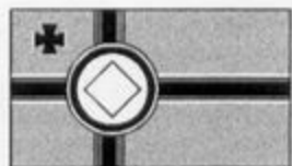
Válečná vlajka War flag Kriegs Flag