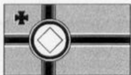
Válečná vlajka War flag Kriegs Flag