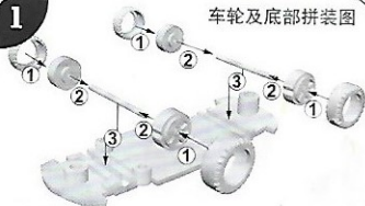
车轮及底部拼装图