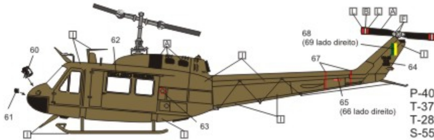
Bell UH-1H do 7º/8º G.Av. baseado em Manaus - AM