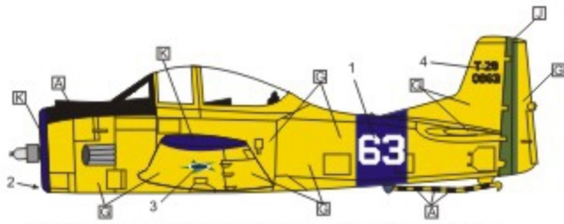
T-28 Trojan do 2º Esq. de Ligação e Observação (E.L.O.), que ficava baseado em S. Pedro D'Aldeia - RJ