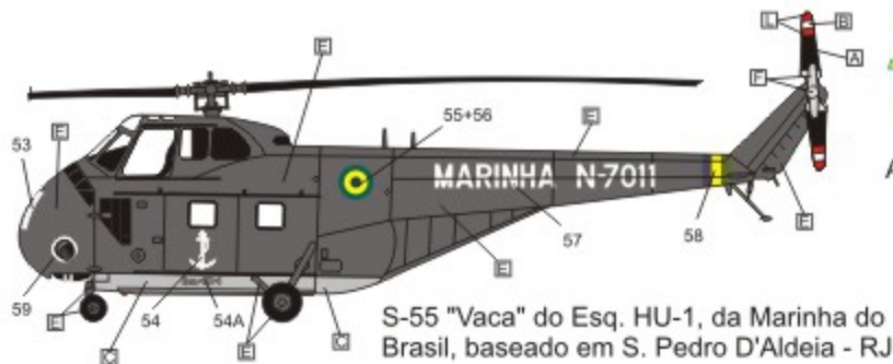
S-55 "Vaca" do Esq. HU-1, da Marinha do Brasil, baseado em S. Pedro D'Aldeia - RJ